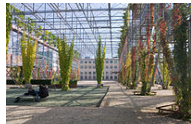
Stadterweiterungsgebiet Neu-Oerlikon mit Oerliker Park und MFO-Park