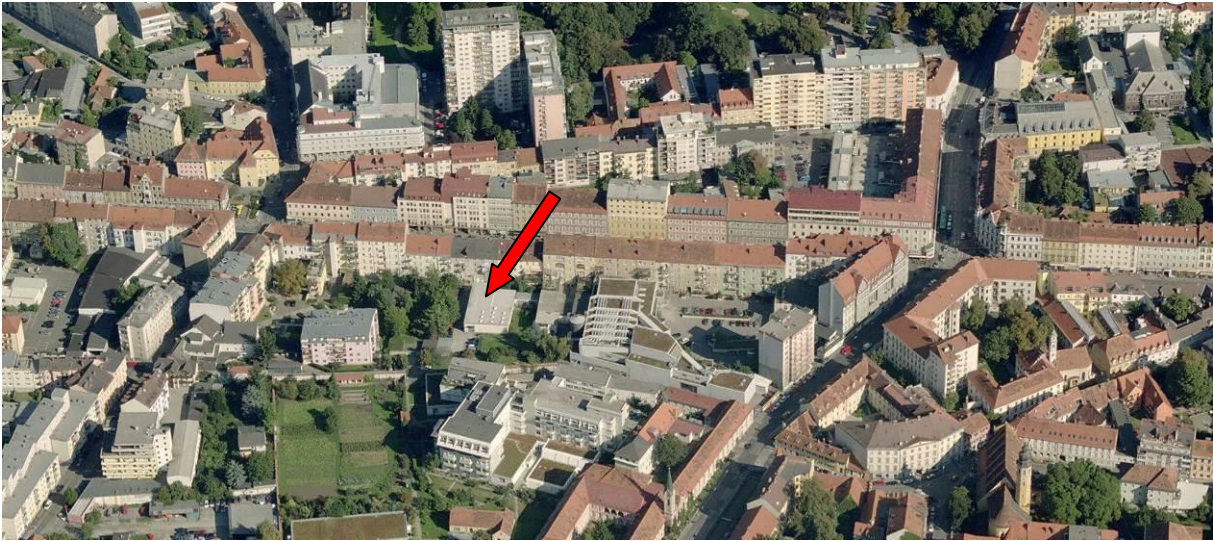
Schrägaufnahme (2007): Microsoft Company © / Vexcel Imaging GmbH, Graz/Austria; Blick in nördliche Richtung.