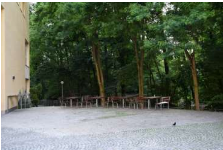
Platz Süden - Blick Richtung Parkanlage, eigene Aufnahme vom 06.06.2018