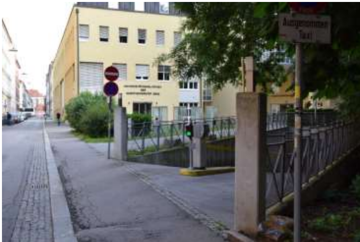
Platz Süden - Blick von Brandhofgasse Richtung Eingang Bibliothek, eigene Aufnahme vom 06.06.2018