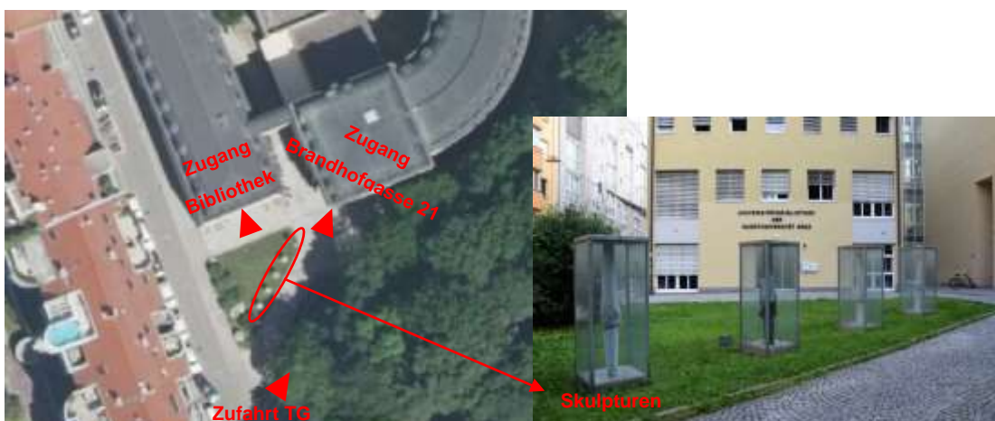
Platz Brandhofgasse 21, eigene Aufnahme vom 06.06.2018