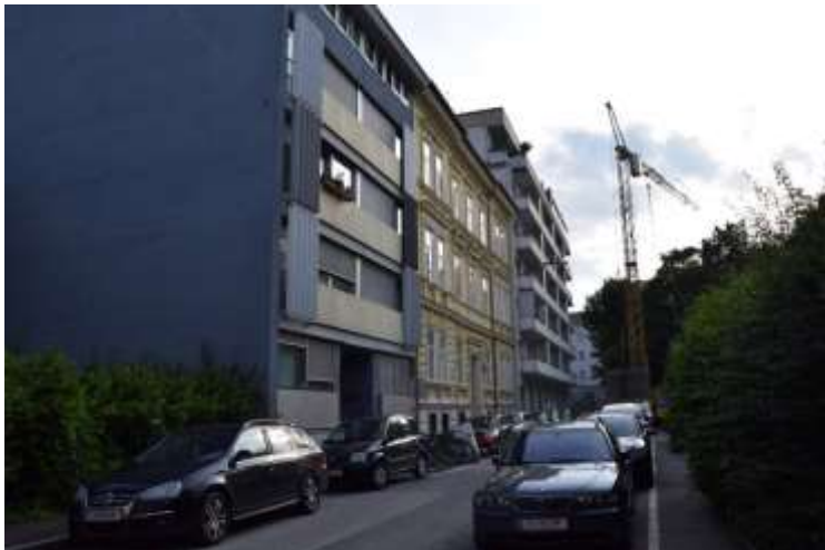
Hauslabgasse - Blick Richtung Osten zur Nachbarbebauung, eigene Aufnahme vom 06.06.2018