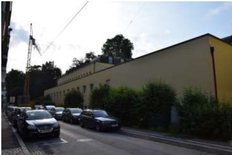
Hauslabgasse - Blick Richtung Osten zur Kunstuniversität, eigene Aufnahme vom 06.06.2018