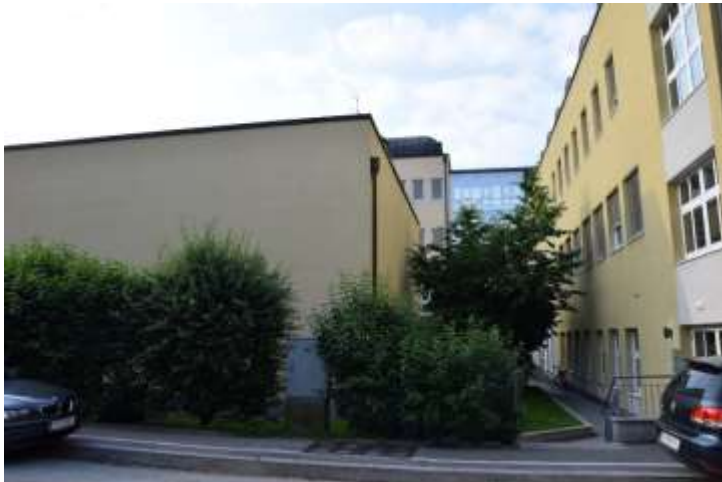
Hauslabgasse - Bereich zwischen den Bibliotheksgebäuden und den Institutsgebäuden (Bereich E), eigene Aufnahme vom 06.06.2018