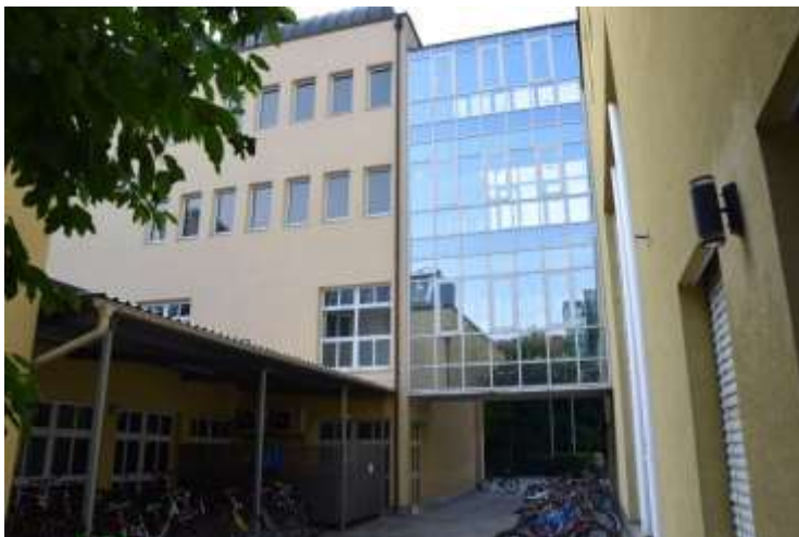
Bereich zwischen den Bibliotheksgebäuden und den Institutsgebäuden (Bereich E), eigene Aufnahme vom 06.06.2018