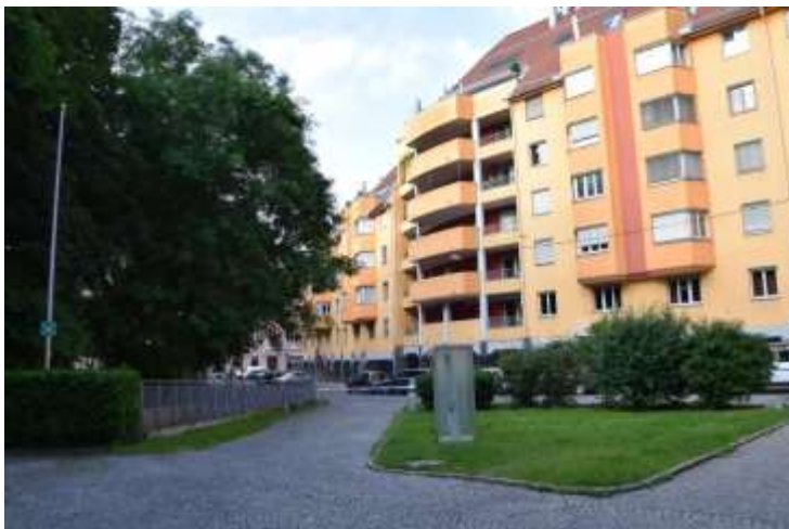
Platz Süden - Blick von Eingang Bibliothek in Richtung Brandhofgasse, eigene Aufnahme vom 06.06.2018